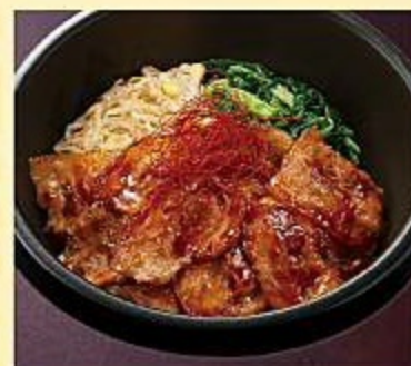
石焼旨辛豚カルビ