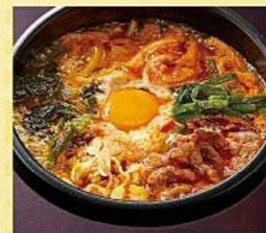
石焼ユッケジャン麺