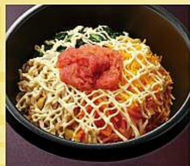
石焼明太マヨチーズ